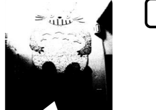
みんなで作ったトロロのちぎれ絵

今年度、新たに2名のお友達が加わり、合計16名のお友達と5名の職員でスタートしています。初めは、進級や進学があり新たな環境での生活に戸惑いを感じている子どもも、徐々に楽しく落ち着いて活動ができるようになりました。天気の良い日には屋外での活動を多く取り入れ、雨の日にはこいのぼりや七夕飾りなどの製作を行いました。今年度も子ども達の気持ちに寄り添いながら、皆が進んで活動に参加できるような内容を考慮し、提供していきたいと考えていますので、宜しくお願いします。