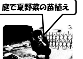
庭で夏野菜の苗植え