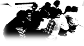
はないちもんめで誰が欲しいか相談中です。名前を呼ばれると嬉しそうにしています。

今年度も、子どもたちが楽しく、様々なことに挑戦できるように一緒に活動をしていきたいと思ひます。