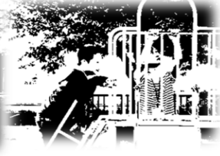
ポカポカ陽気の日少し遠くの公園へお出掛け。色々な遊具があって楽しそう♪

『七北田つばめっこ』 住所:981-3131 仙台市泉区七北田字日野123-9 TEL:022-372-0031 FAX:022-739-7236