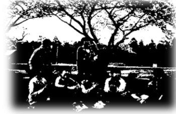
満開の桜の下でお花見！中には花よりだんごの子もいました(笑)

今年度、新たに5名のお友達が加わり、31名のお友達と8名の職員で活動をスタートしました。新年度が始まり、早くも3か月。最初は栄つばめっこの環境に戸惑いを見せていたお友達も、今では活動を楽しんでいます！季節や下校時間に合わせた活動を設定して、天気の良い日には公園で思いっきり身体を動かしたり、みんなが早く揃った日には図書館やお買い物へ行ったりと、様々な活動をしています。気が付けばもうすぐ夏休み。子ども達の大好きなプール活動や、放課後の活動では行くことの出来ない、遠くの場所へのお出掛けも計画しています。これからもみんなで元気いっぱい楽しく活動していきたいと思ひます。