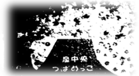
完成した壁面春バージョンです。皆で協力して作りました。

今年度、6名の子も達が加わりました。全員で27名のお友達とスタッフ7名で活動をしています。天気の良い日は泉中央公園や、七北田公園で元気に活動したり、室内ではフォトフレーム作り、ピースアートなどをして過ごしています。新たに壁面作りにも挑戦しました。春バージョンは、障子紙に絵具で色を付け貼り合わせ桜の木を表現しました。また、最近では、はないちもんめやハンカチ落としなど集団で遊ぶことも多く人気の活動です。おやつは、お友達と楽しんで手作りする経験や、お店に行き自分で選び購入する経験を多く設定出来れば良いと考えています。